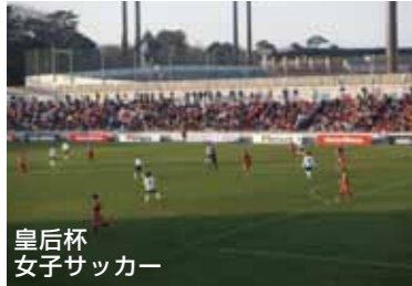
皇后杯女子サッカー