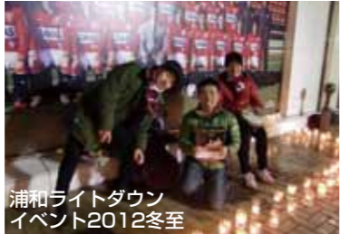
浦和ライトダウンイベント2012冬至