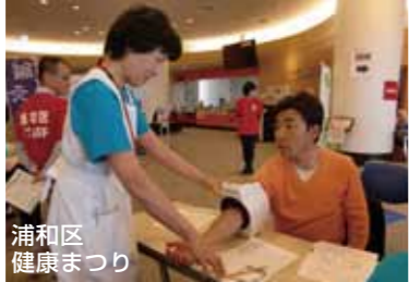
浦和区健康まつり