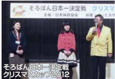
そろばん日本一決定戦クリスマススナップ2012