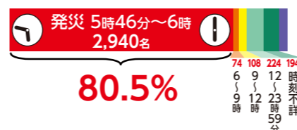
表1、2とも阪神淡路大震災におけるデータ