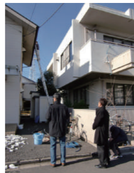
針ヶ谷放射線測定会

笠倉出版社 『スーパーキッズを育てた! そろばん式暗算術』にコメントが掲載されました