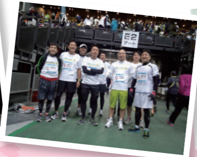
さいたまシティマラソン20km完走!