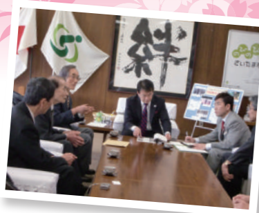
浦高通り無電柱化の陳情対応