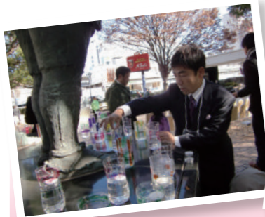
浦和ライトダウン2011で準備中!