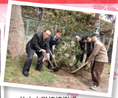
仲本小学校植樹式