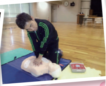
救急救命講習にも真剣に参加