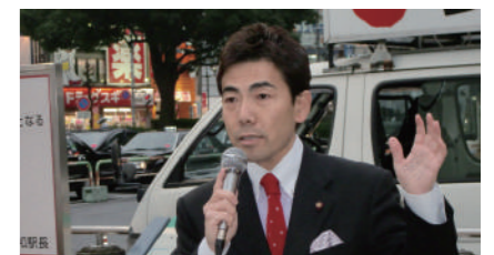
毎月第3日曜16時から浦和駅西口駅頭でお伝えしています。