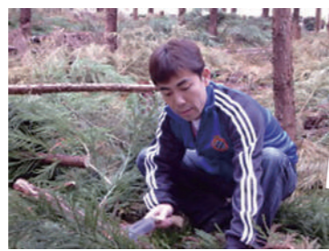
浦高百年の森事業で作業中!